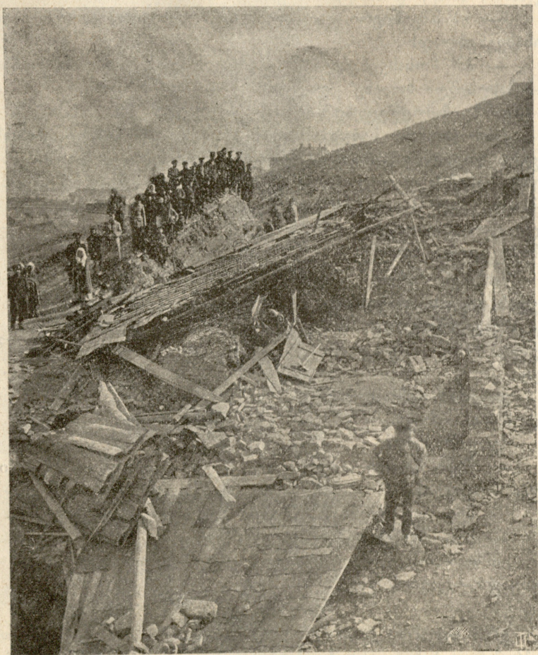
დანგრეული სახლი რომელიც ვერაზე მამადავითის მთიდან მოსხლე-ტილმა კლდემ დაიტანა.