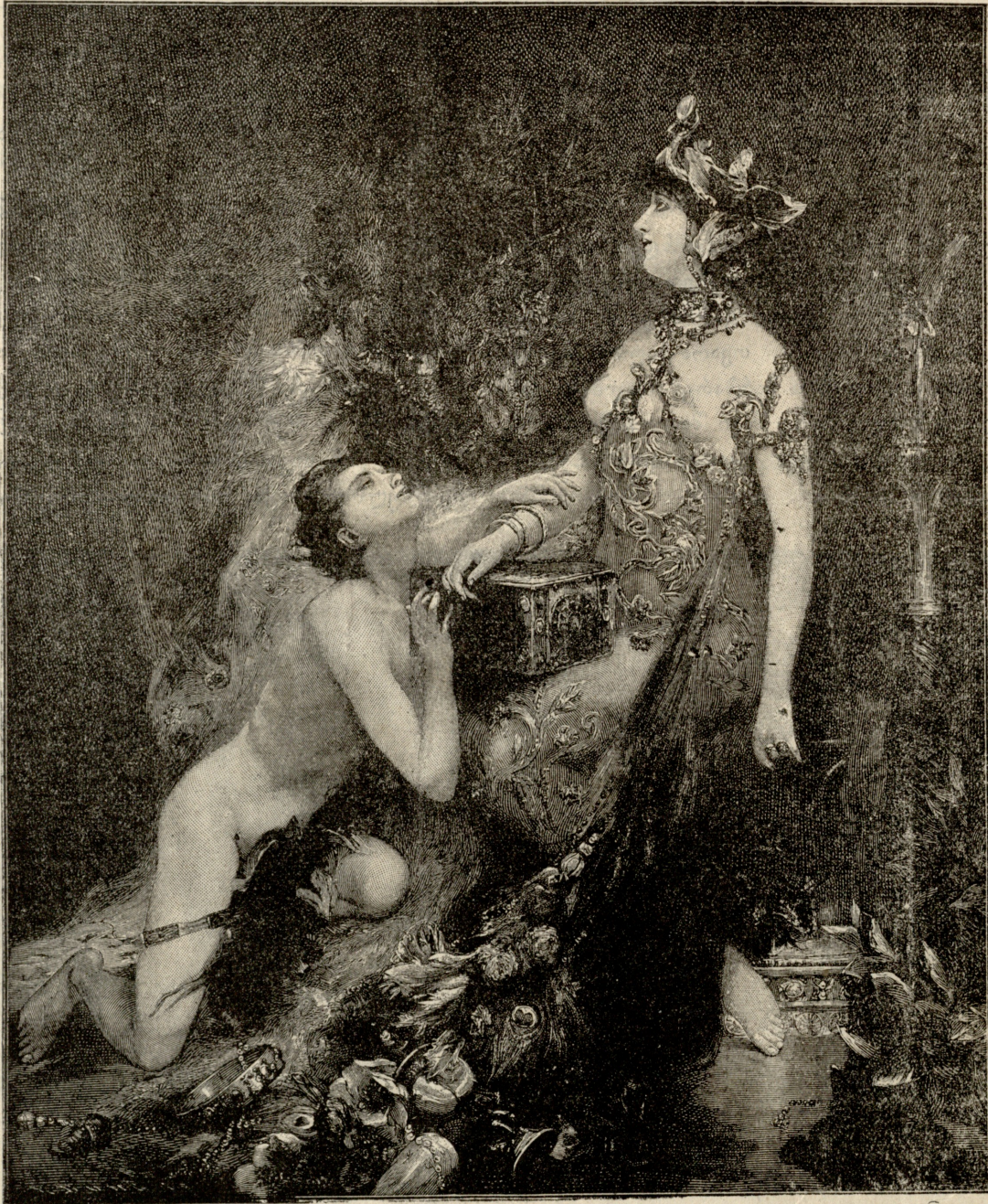
თაყვან-საცემი კერპი, — სურათი ღარიკოსი.

ყინვაში მამა-კაცივით უნაგირზე გადამჯდარს და ნაბად წამოსხმულს მგზარობა სოფლიდან სოფლად. ბევრი მომაკვდავი მშობიარე დაუხსნია თავის გამოცდილის ბებიობით. შორს იყო იმისი სახელი განვარდნილი. ყოველ კუთხიდან მოდიოდნენ. განუწყვეტლევ იყო მის კისკარზე მიბმული შეკაზმული ცხენი. ყოჩადი იყო ბარბარე, ამდენ სიარულთან ოჯახსაც რორ თადარიგს უწევდა. მეტ სახელად „ქვეყნის მალამოს“ ეძახდნენ. ყოველ ოჯახში სიცოცხლე და სიხარული შეჰქონდა, თავის მხიარულ ხასიათითა და ენით. „მკვდარსაც-კი გააცინებსო“, ამბობდნენ.