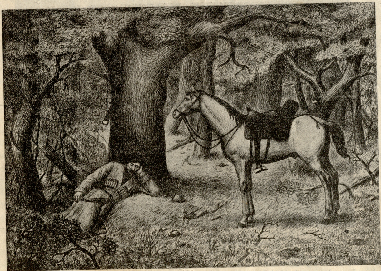
კაკო შაჩალი (ილია ჭავჭავაძის პოემიდან), — სურათი მრეველიშვილისა.

— გამეეტიე, ადამიანო! ჩვენ მისვლამდი თუ ქე მოკვტება, მერე შენ რალა საჭირო ხარ! — დაუძახა მოხუცს სახლის წინ თუთის ხეზე მიყრდნობილმა კაცმა, რომელსაც იგი მელოგინე ქალთან უნდა წაეყვანა.