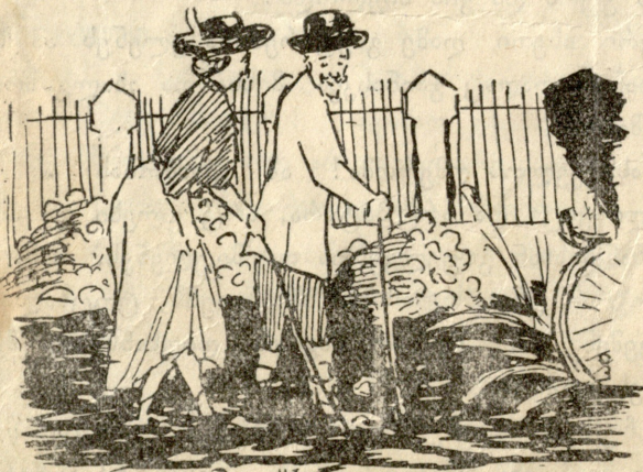
მუთაისის ძალაქის ბაღთან.

— მებაღე ბაღში იძინებს... ოთახში შემოდი, ნელა-კი... დავსხდეთ, ერთმანეთს უცქიროთ და ვიჩურჩულოთ...—მოჰხვია ხელი ქოჩორა თმაზე, შუბლზე აკოცა და მერე ფანჯრიდან დაეშვა იატაკზე. ივანეც გადაჰყვა.