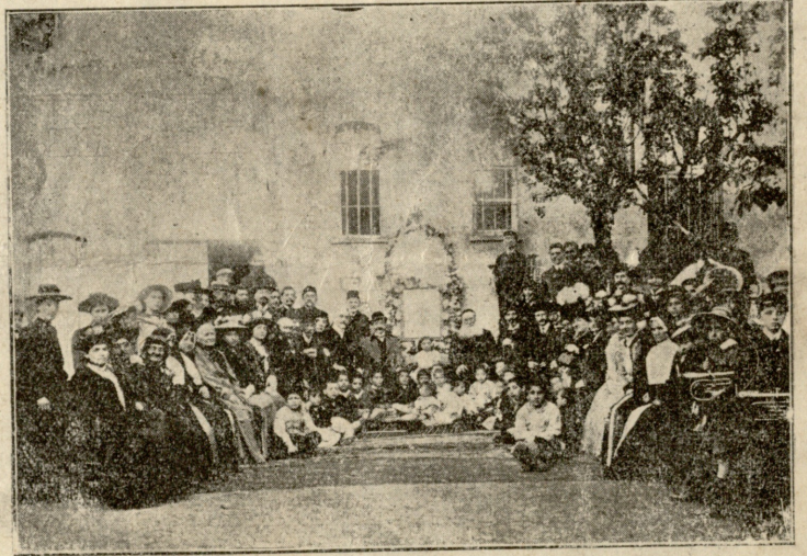
აკაკის იუზილენი სტამბოლში 26 აპრილს. (იხ. «დროება», № 101)

ეხლა კი შევიყარნით ორანიც კაი ყმანია; ქისტების ჯავრს ამოიყრის ჩემი ფრანგული ხმალია. გამართეს სმა და სიმღერა, ლუდი სვეს ჯიხვებითაო; ამბობენ: ჩვენი მფარველი უფალიმც იქნებისაო; გვწყალობდეს ხახმატის ჯვარი ღუშმანი ქისტებისაო, გაუწყდეთ ტყვია-წამალი ღილღვებსა ღვთის ნებითაო, ტიროდენ ცხელის ცრემლითა დედანი ღილღვებისაო.— ძმობილნი ასე ამობენ ერთ ურთის იმედითაო; ომს ბედვენ ხმლით და თოფითა, განა თუ ისრებითაო. გათავდა აქ რა სადილი, საგზალი მოიშხადესა,