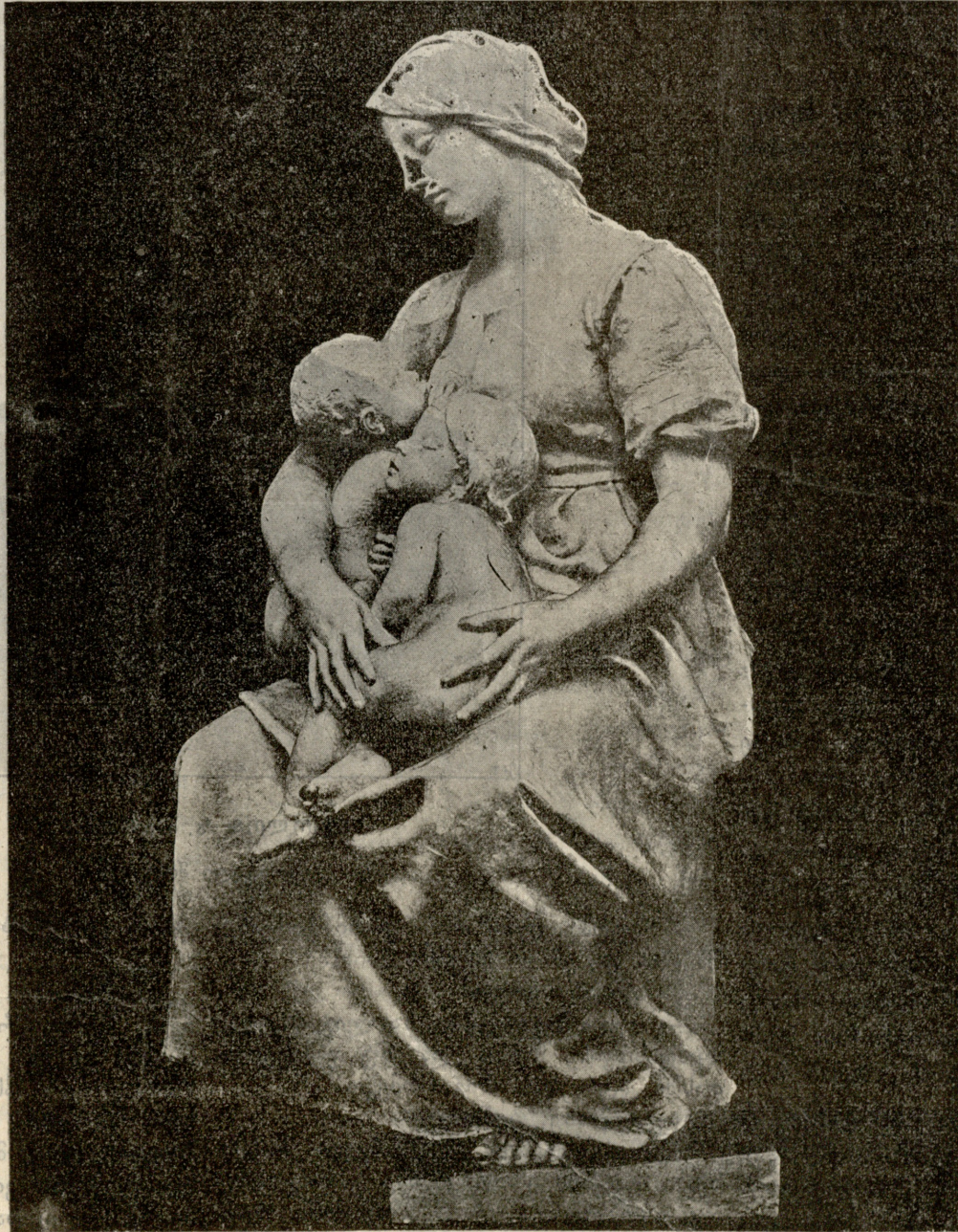
მამა-მომხმეობა, — ქანდაკება ლიუბუსკი.

გაზეთის № 136. კვირა, 21 ივნისი 1909 წ. დამატების № 24.