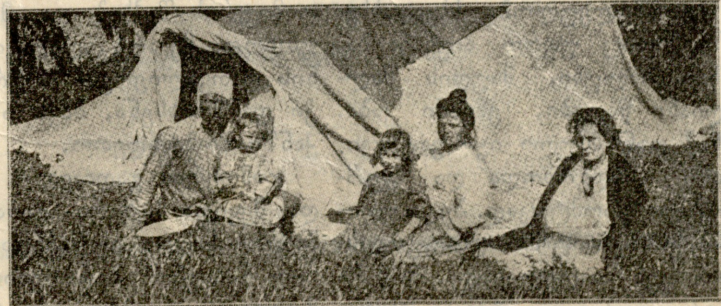
მიწის-ძვრა სამხრეთ საზრანგეთში.

სოვდაგარი ყველა ამას წყნარად უყუ- რებდა, წარბ შეუხრელი. ან კი რა ჰქონ- და დასაღრეჯი და რაზედ უნდა დაწუ- ხებულყო, როდესაც ყოველივე შექმუ- ლი თვ გაყიდული, ნანისიავებული თუ ნი- სიად გაცემული ჩაწერილი იყო და პირნა- თლად ნანგარიშებული? თანხა, მართა- ლია, ბარდებში გაბმულიყო და მიღვეულ-