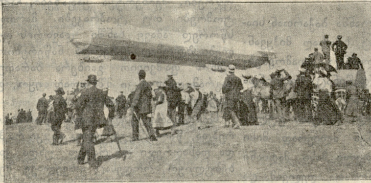
მზრინავი ხომალდი ცეკელინისა.

მაგრამ დიმიტრი სრულებითაც იმაზე არა ფიქრობდა, რომ ღვარძლიანთან დამოყვრებით მისი საგვარეულო სისხლი უნდა შემღვრეულიყო, ის ეხლა მწარედ დაჰყურებდა შრომისაგან დამონავებულ თვის ხელებს, ჯაფისაგან დაკოჩიქებულ თითებს და უკვირდა ბაქარის ძლიერი ალლო ცხოვრებისადმი. დიმიტრის უკვირდა, რომ ბაქარი ყოველთვის ხელგაუნძრევლად ახერხებდა თბილ ცხოვრებას, რომ ბატონ-კაცური ყოფნა თითონ ილტოდა ბაქარისაკენ. აი ეხლაც, ღვარძლიანიც და მისი ცხოვრებაც ამ კაცისა გამხდარა და მანამ სესია ფეხზე იდგება, ბატონ ბაქარს არა გაუჭირდება რა. თითონ დიმიტრი კი შრომობს განუწყვეტლად და ჰგრძნობს, რომ სიკვდი-