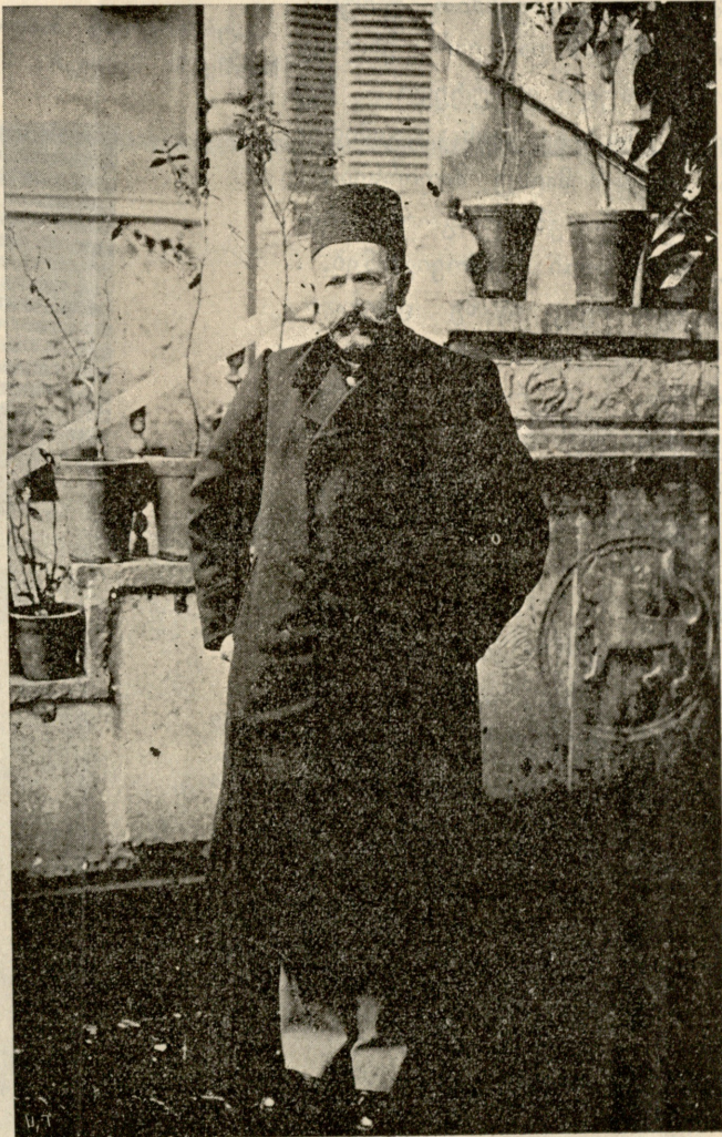
ს ე ვ ე ხ დ ა რ ი,

გულამოსკვნით დაიწყო ილიინსკაიამ, — რაა სიცრუვე? თან ტუჩებს ღვინით ისველებდა, — ჩვე- ნი წრე, მე ეხლა სიამოვნებით ვრწმუნ- დები, რომ ის პარები, რომელთაც ჩვენ შეხედულებასთან საერთო არა აქვთ რა; რისთვის?! რად?! რამ გაიძულათ? თქვენ, სხვა და სხვა მიმართულების ადამიანები პატივისცემით გვეკიდებიან.. რად მიც- მელიც ასე გულწრფელად, უიმედოდ ქერით აგრე, საყვარელო ყმაწვილო? ან მიყვარდა, ვერ გამემჟღავნებინა მისთვის შეიძლება დარწმუნდით, რომ მე თქვენ ჩემი გულის ნადები... მეკრძალებოდა, გადაკვირთ შეგებეთ? დიახ, მე თქვენზე ვაი თუ თქვენი გულის წყრომა დამემ- ვამბობ: მე ხომ კარგად ვიცი, რა თვა- სახურებინა, რადგან უგვანო... არა რა- ლითაც უცქეროდით ქალებს. ვიცი, ობა. უღირსი... ბურჟუა ვარ! როგორ ყურჩამოყრილი ბრძანდებოდით ხელები სახეზე მიიფარა და ამ ყოფა- სტუდენტთა ბალებზე, ხოლო სიხარულით ში დაჰყო ერთ წუთს, მერე სტაცა ხელი