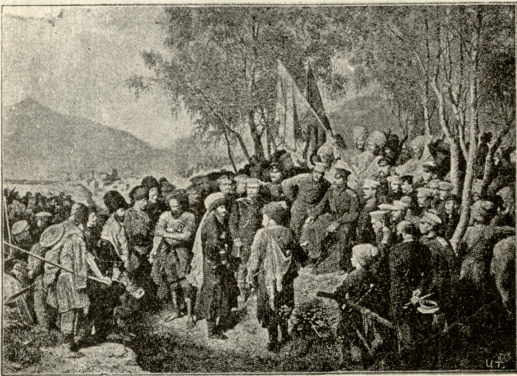
შამილი თავ. ბარიათინსკის წინ გუნიბის ალების შემდეგ, 1859 წ. 25 აგვისტოს. სურათი ტ. გორშელტისა.

ლელა. (გვერდზე გაუფლის ტიტოსა და თავზე ხელს გადაუსვამს) რატომ შენ კი არ ისაძილობ? ტიტო. არ მინდა.