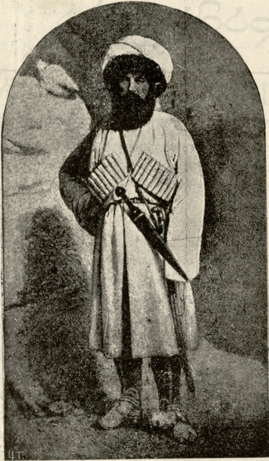
დაღმსტინისა და ჩაჩის იმამი შამილი.

ლელა. (ართმუვს) როცა ყველაზე საუკეთესო და ოცნების გუნებაზე ვიქნები, მაშინ ვიმღერებ ხოლმე ამ ლექსს