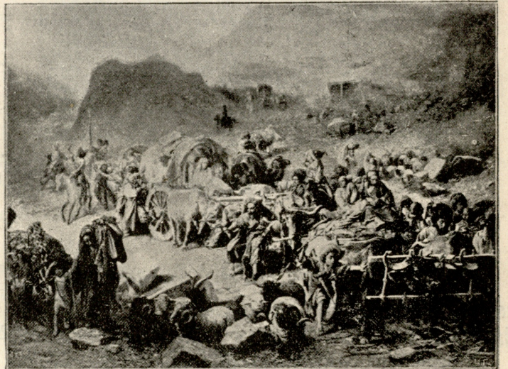
ჩაჩაფიების გადასახლება, —სურათი პ. ნ. გრუზინსკისა. გუნიბის ალებისა და შამილის დამორჩილების შემდეგ დიდძალი ჩერქეზობა გადასახლდა ოსმალეთში.