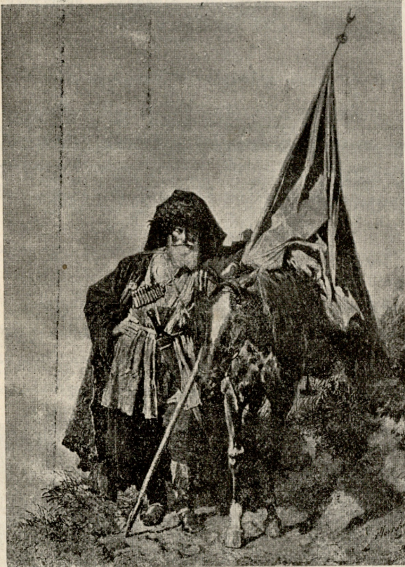
მოხუცი ლეკი დროებით. სურათი ტ. გორშელტისა.

ექვთ. სად გაგვექვით, ჰა? რატომ ბაღში არ გამოასეირნე,