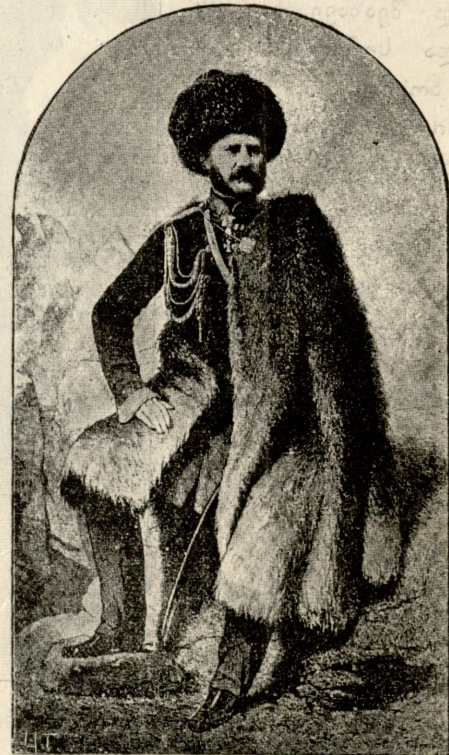
არჩის ჯარის მთავარ-სარდალი თავ. გარიატინსკი, გუნების ამღები.

არჩილ. ინტერესსაცა და სიყვარულსაც ისეთი მაგნიტიური ძალა აქვთ, რომ თუ ერთი მოიჯადოვებს ადამიანი,