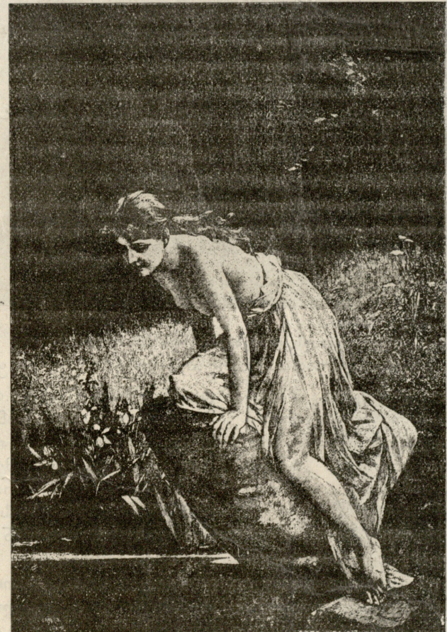
სატრფო, — სურათი ტუმონისა.

— ბიჭო, დათიკო, აგერ მგელი, ჩვენ კენ იხედება, — მეტყოდა შემკრთალი მიხა.