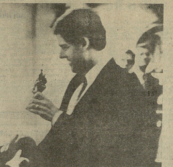
ახალიკიდასის სურთი... (Caption describing the photo above)