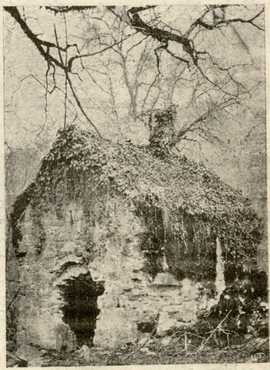
სანგილოში მერვე საუკუნეში მეფე არჩილის მიერ ს. ლექეთში აშენებულ ეკლესიის ნანგრევები. ზედ ფათალო ამოხუთა და ჰდარავს ეკლესიას.