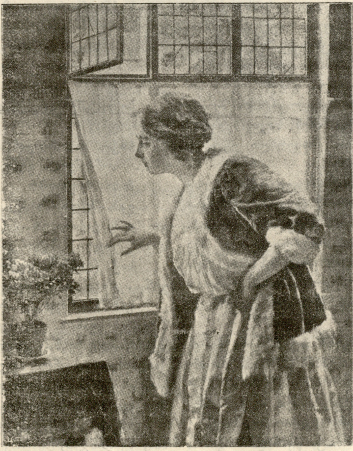
ლოდინი. სურათი ვ. მაკ-ვეენისა.