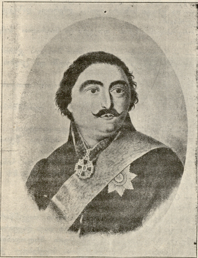
პანტანგ მემფისი. — (ქართულ სტამბის 200 წ. არებობის გამო).

— ეჰ, გოუჩდება, შვილო, გოუჩდება! მართალს ამბობ მარა აპა რა უნდა მექნა? მე აღარა შემძილიარა: ხომ ხედავ—სული კბილით მიკავია. მტრისა და ავისას, რო რამე გამოქირდეს, ვინ იქნება თქვენი მამხედავი? ცოცხალ ადამიან მტერიც უნდა ჰყავდეს და მოყვარეც. ხომ იცი, რანაირ დროში ვართ: ყველგან გზირი დგას; სოფელ-ქვეყანას ზეკუცაა მოდებია, მათი შიშით ნალიაში სიმანდი ვეღარ დაგვიტოვებია და ქურში ღვინო.