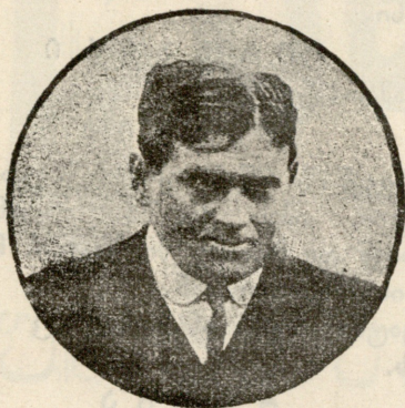
მზრინავი უბოჩინი. რომელიც დღეს უნდა აფრინდეს).