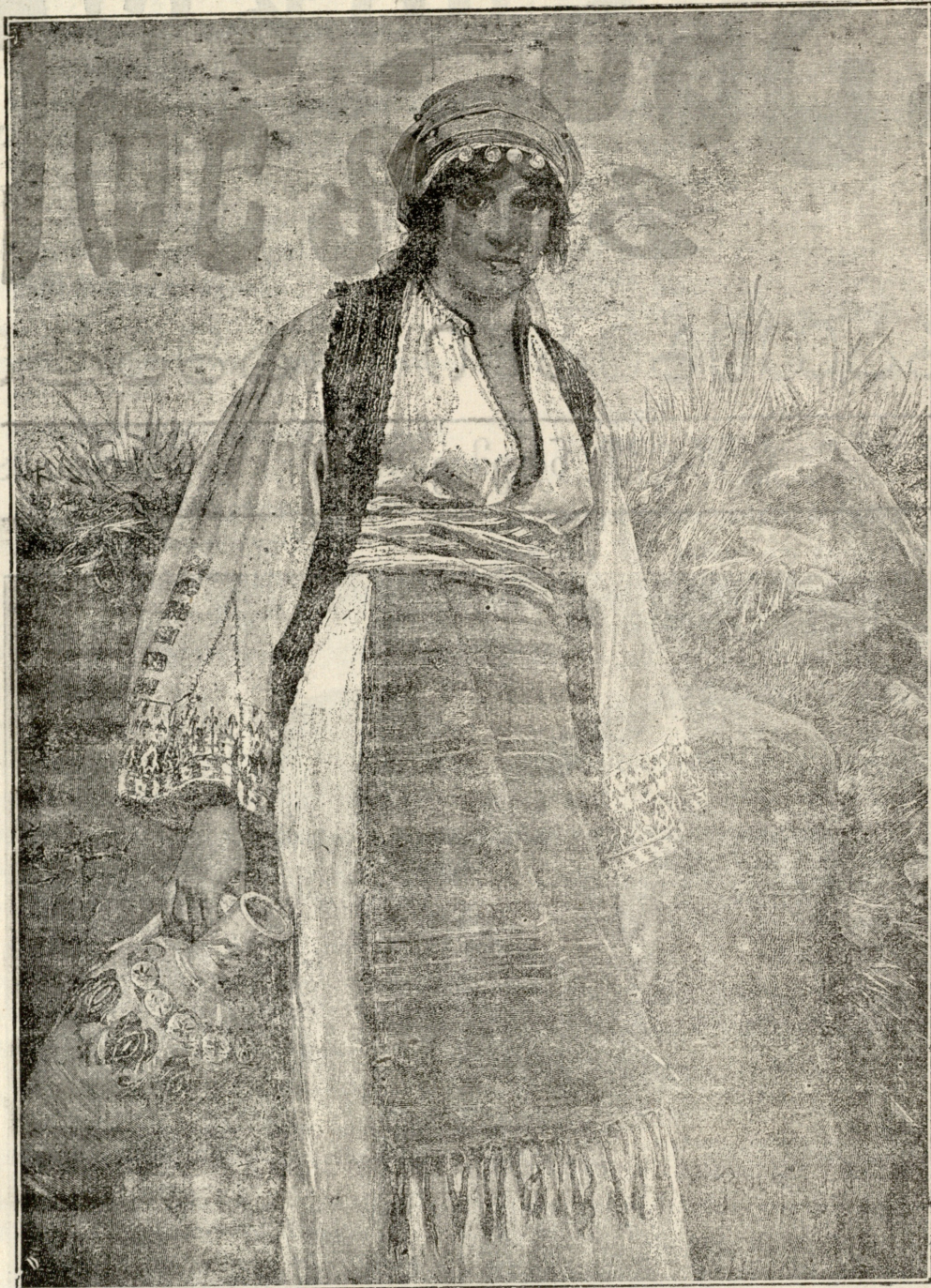
რამ დააფიქრა! — სურათი პოლიტიუმანისა.