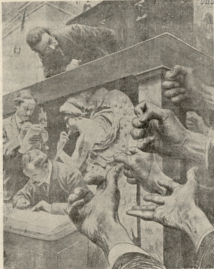
საფრანგეთის დეპუტატთა კალატის სადგომი 29 ოქტომბერს. საერთო ალიაქოთის დროს, უკიდურეს მემარცხენეთა მოღვრილ მუშტების წინ, მინისტრ-პრეზიდენტი ბრიანი, ტრიბუნიდან გადაბრილი, სცილობს თავისი სიტყვა სტენოგრაფისტ მიანც გააგონოს.

მეგობარი. ვერც შენ გახდი, რომ ფიქრობდი, დიდებული შემოქმედი. გეგონა, რომ მარმარილოს სიცოცხლის სულს ჩაჰბერავდი, შენ თავსაც და სამშობლოსაც მით უკვდავ ძეგლს დაუდგამდი. მაგრამ ჰხედავ, რომ შენ უფრო საფლავის ქვა გემარჯვება, ვიდრე შექმნა დიდებული ღვთაებრივი ქანდაკება.