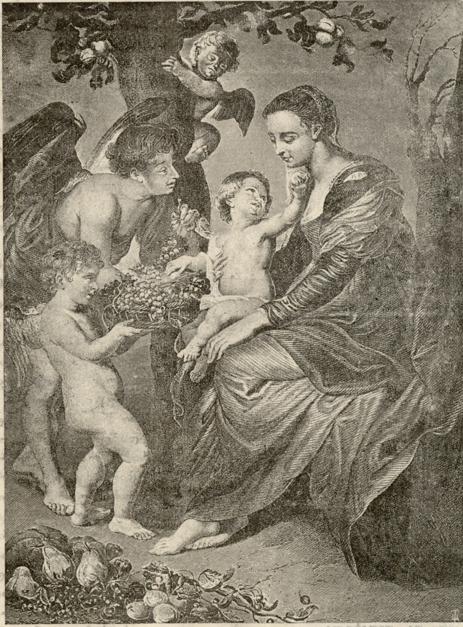
ღვთის მშობელი ბავშვით. სურათი რუბენსისა დრეზდენის გალერეიდგან.