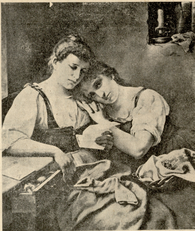
ფერილი გულის სწორისა.