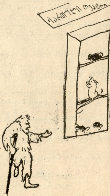
ქართულ თევზების კასა.