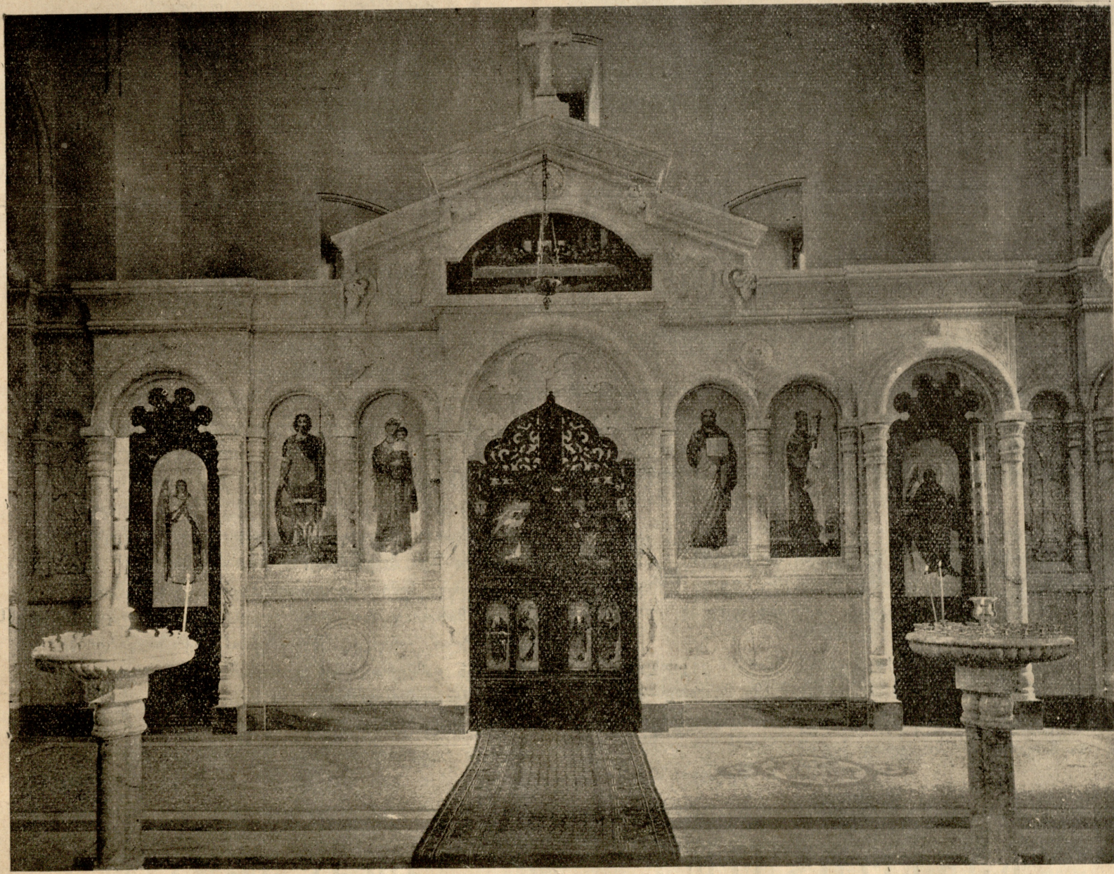
მკაფიის ტაძრის კანკალი.