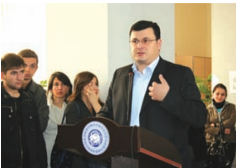
„პირველობა საქართველოსა და კავკასიაში მართლაც საამაყოა, მაგრამ ეს ლიდერობა, რაც ჯერ კიდევ მოსაპოვებელი გვაქვს, მეტ პასუხისმგებლობას გვაკისრებს. უნივერსიტეტის უკეთესი მომავალი სტუდენტთა აქტიურობისა და თანადგომის გარეშე წარმოუდგენელია“, — ასეთია თსუ-ის რექტორის მოვალეობის შემსრულებლის ალექსანდრე კვიციანიშვილის მოსაზრება, რომელიც უნივერსიტეტის ეკონომიკისა და ბიზნესის, მედიცინის და იურიდიული ფაკულტეტების სტუდენტებს შეხვდა იმ მიზნით, რომ მათი მოსაზრებები და შენიშვნები მიესმინა.