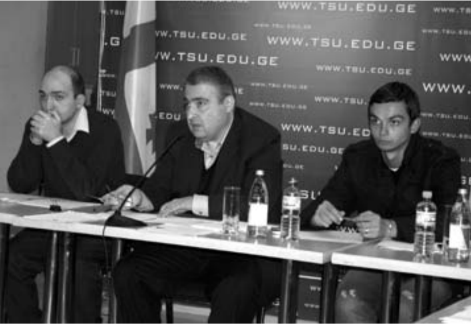
წარმომადგენლობითი საბჭო (სენატი) უნივერსიტეტის მართვის ერთ-ერთი უმნიშვნელოვანესი ორგანოა, სადაც ფაკულტეტების წარმომადგენლებს ხებისმიერი საკითხის დასა და სხვადასხვა პრობლემის განხილვა შეუძლიათ. აქ მსჯელობენ საუნივერსიტეტო გარემოს გაუმჯობესებაზე, სტუდენტთა წინადადებებზე, სწავლისა და სწავლებისთვის ხელსაყრელი პირობების შექმნაზე. ამიტომაც წარმომადგენლობითი საბჭოს არჩევა ერთ-ერთი უაღრესად საკვლელო მოვლენაა საუნივერსიტეტო ცხოვრებაში.