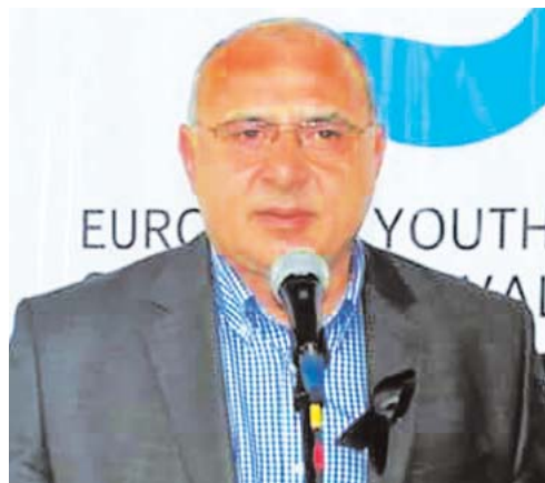
დღევანდელი დღის მადლი და ძალა ფარავდეს ჩვენს ერს, რომელსაც უფლის შემწეობა და სიყვარული არასდროს მოჰკლებია! 19 აგვისტო გამორჩეული

დღეა საქრისტიანოს იმ დღესასწაულთაგან, რომელსაც მართმადიდებელი ეკლესია განსაკუთრებით აღნიშნავს! სიმბოლურია, რომ ფერისცვალების ტაძარი გურულებისთვის გამორჩეულ და სიყვარულად აღვიღებ, ბახმაროში მდებარეობს! ამ დღეს საზეიმო ზარების რეკვა ზღვის დონიდან 2050 მეტრზე მთელს გურეას ესმის და სიხარულით ავსებს! გარწმუნებთ, რომ სამომავლოდ ჩვენ შევძლებთ, ჩემი და თქვენი ბახმარო უფრო მიმზიდველი და ფერშეცვლილი ნახოთ, ვიდრე დღესაა. ოპტიმიზმის საფუძველს ის დიდი ინფრასტრუქტურული პროექტები მაძ-