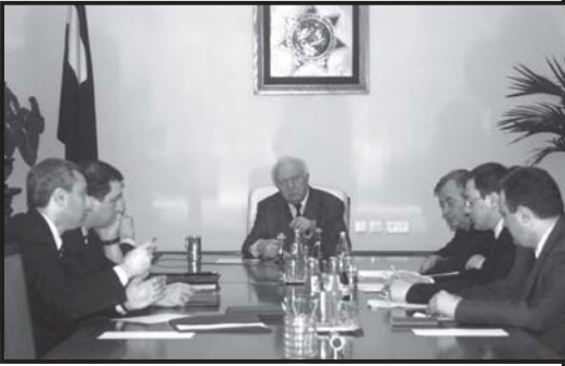
თუმცა გარკვეულ სასიკეთო პერსპექტივას უნდა შევქმნიდეთ...