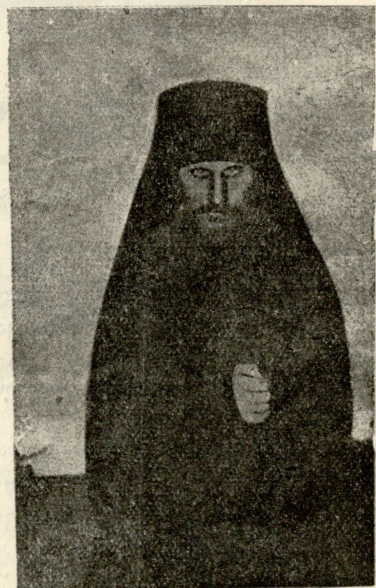
გიორგი რასპუტინი (იხილეთ ღღვეანდელი გაზეთი).

— მაშ უნდა დამელოცნა ღვეანი, როდესაც სახალხოდ მლანძღა მან და მაგინა; თავი უნდა მომეხარნა მის წინაშე, როდესაც მძლავრობდა ის ჩემზე და მამდაბლებდა. აკი ესე მოვიქეცი შემთხვევით, სიტყვა ვერ შეუბრუნე, მაგრამ არამც თუ საქებად არ ჩასთვალეს ჩემი ქცევა, მასხარადაც ამიგდეს. ან რას გააგონებ აშვებულ ძალას, თუ ძალავე არ დაუყენე წინ და არ შეზღუდე მომრეობა?! დაახვედრე მგელს დათმობა და იგი თავს აუშვეს, განამრავლებს ბორბლს თვის გარშემო — ფიქრობდა ილიკო და უფრო ესმოდა მოსეს დარიგება: კბილი კბილისა წილ და თვალი თვალისა.