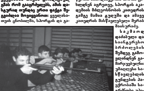
სპორტის განვითარებისათვის... სპორტის განვითარებისათვის...