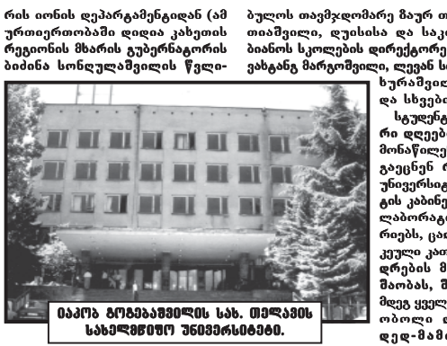
თელავში სტუდენტური დღეების დასრულება