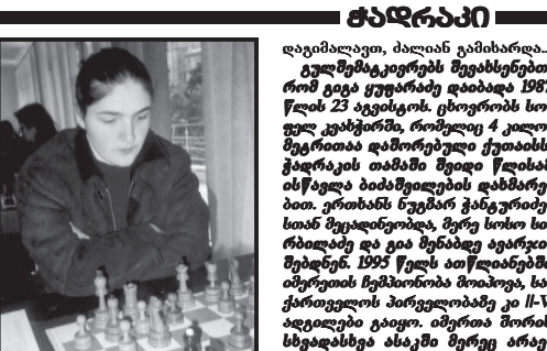
მარიამ ბერიძე... საქართველოს პარლამენტის წევრი...