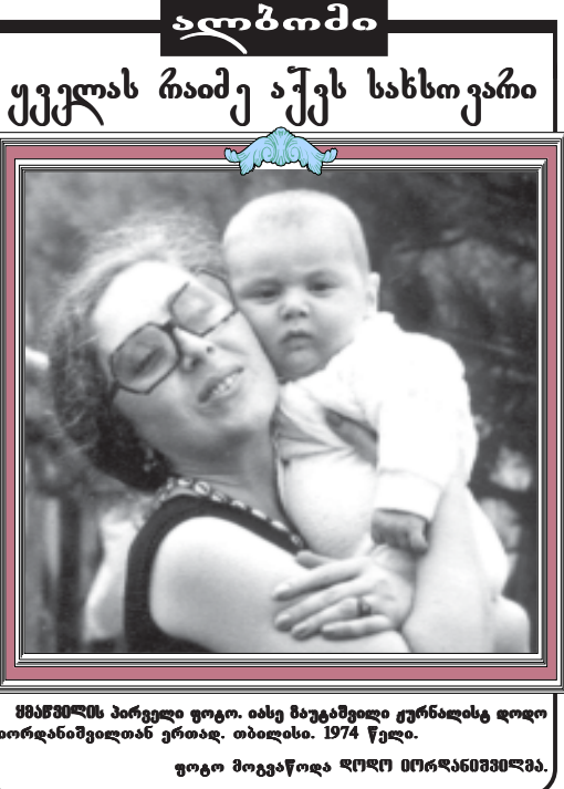
ფოტო მოგაწვიათ და ფოტო იმეორებთ. თბილისი. 1974 წელი.