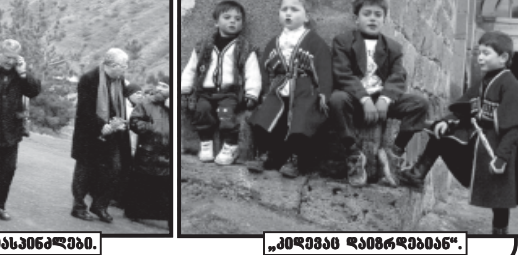
მთის მხარის დასახლებაში.