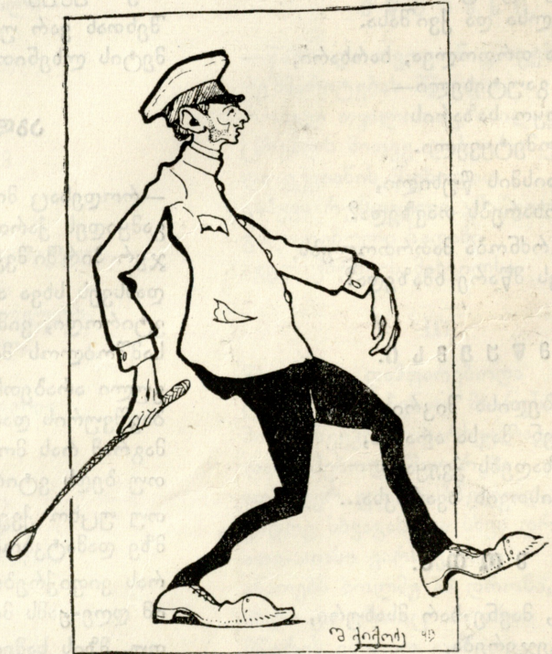
ჩ ვ ე უ ლ ე ბ რ ი ვ ი მ ო ზ ლ ე ნ ა .