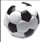
ფეხბურთის მსოფლიო ჩემპიონატის მატჩის დროს.