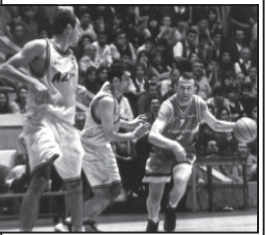
კალათბურთის მსოფლიო ჩემპიონატის მატჩის დროს.