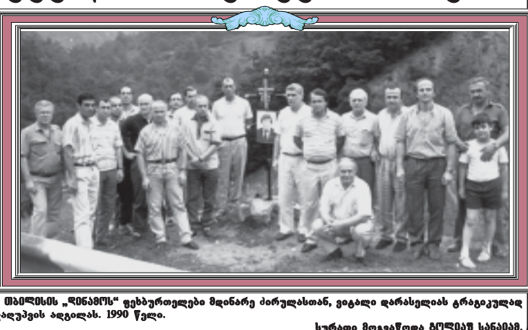
თამარის „რინგის“ ფეხბურთელები მდინარე პარულსთან, ვიგალი დარსიელის გრატიკულად დაბეჭდვის ადგილას. 1990 წელი.