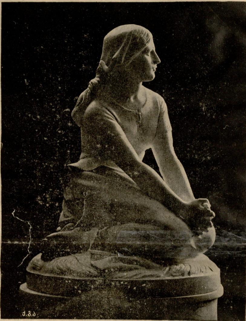
უან-დარკი. — ქანდაკება.

მერე ისევ სინჯვა დაუწყო. ატრიალებდა ხან წაღმა, ხან უკულმა, ხან გახედავდა გვერდზე ცალი თვალთ, ხან ორივე თვალს მილულავდა და მისჩერებოდა პირდაპირ, თან სიხარულით ილიმებოდა.