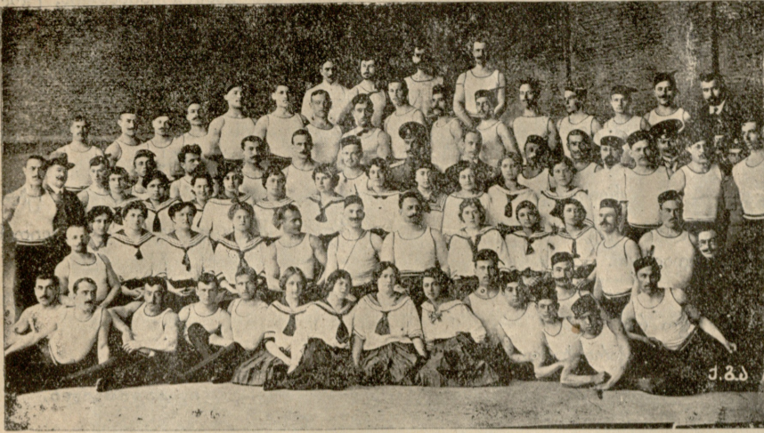
ტფილისის „შევარდენთა“ საზოგადოება.

ბევრს რასმეს ამბობდნენ ამ ერთობისას, მაგრამ დიმიტრი ერთს განმარტებულ ხელმოსაჭიდს ვერას ჰხედავდა.