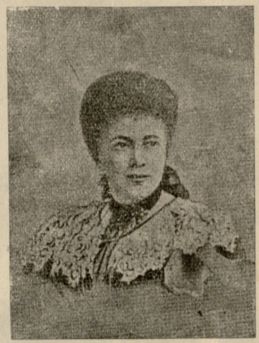
მშვიდობიანობის მოხარჩლე ბერტა ფონ-ზუტენერი (გარდაცვალების გამო).

— აბაიმი, კნიაზო (სოლო ამ სიტყვის თქმის დროს ილიმებოდა)! კიდევ შვილებს გვეძახით?! რამდენი საუკუნე გვეძახეთ ვერე, მაგრამ მამინაცვლობაც ვერ გაგვიწიეთ; თქვენი თავიც დაჰლუპეთ და ჩვენცა! ბატონებად თქვენა სცხოვრობთ და შვილებს ჩვენ გვეძა-