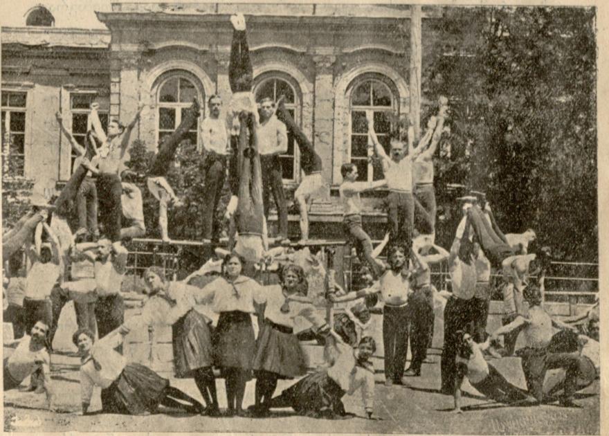
ტფილისის „შევარდენთა“ საზოგადოების ვარჯიშობა.

მტირალა თამარს დედა მიჰშველებოდა და ამშვიდებდა.