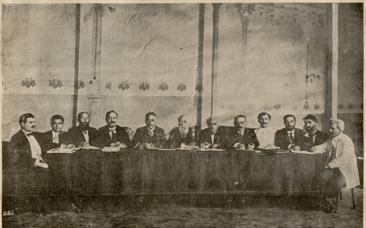
სრ. საქარ. სასც. მოღვ. პირველი ყრილობის პრეზიდიუმი. შუაში ზის ყრილობის საპატიო თავმჯდომარე აკაკი. მის მარჯვნივ თავ- მჯდომარე გ. ლასხიშვილი, თავმჯ. ამხანაგები მარჯვნივ: კ. აბაშიძე და ა. კრინიციკი; მარცხნივ: ვ. ალექსი-მესხიშვილი და ი. ბარა- თაშვილი, მდივნები მარჯვნივ: ი. რომანიშვილი და კ. ანდრონიკაშვილი; მარცხნივ: შ. დადიანი, ჟანტურიშვილი, ი. იმედაშვილი და პ. ირეთელი.