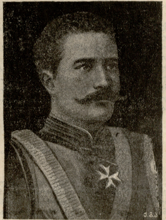
გერმანიის მამა ვილჰელმი (ახალგაზღვრებაში).

მიქელის სიტყვამ დავეთხს გულს სიხარული მიჰფინა; თვალები გაუბრწყინდა, თავი ვერ შეიმაგრა და უეცრად დაფარდა მიქელის წინ.