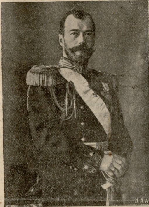
რუსეთის მეფე ნიკოლოზ მეორე.