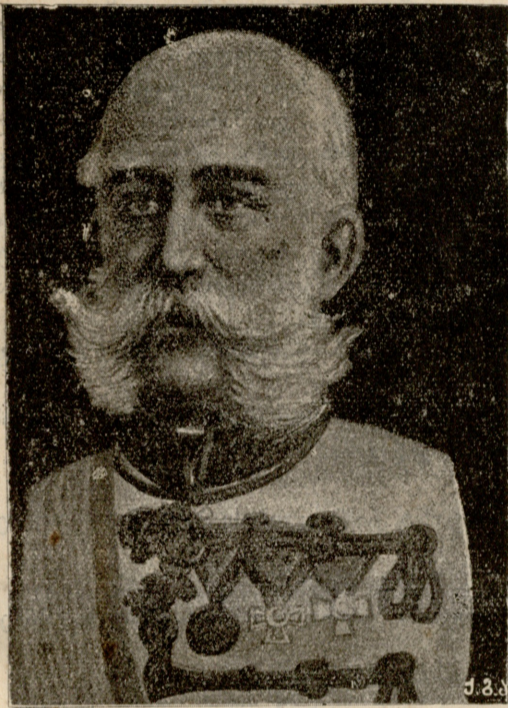
ავსტრიის მამა ფრანც-იოსები.