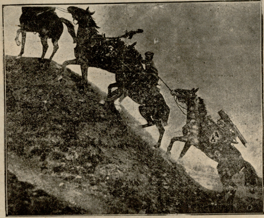
ტყვის მფრეხველის აბანა გორაკი.