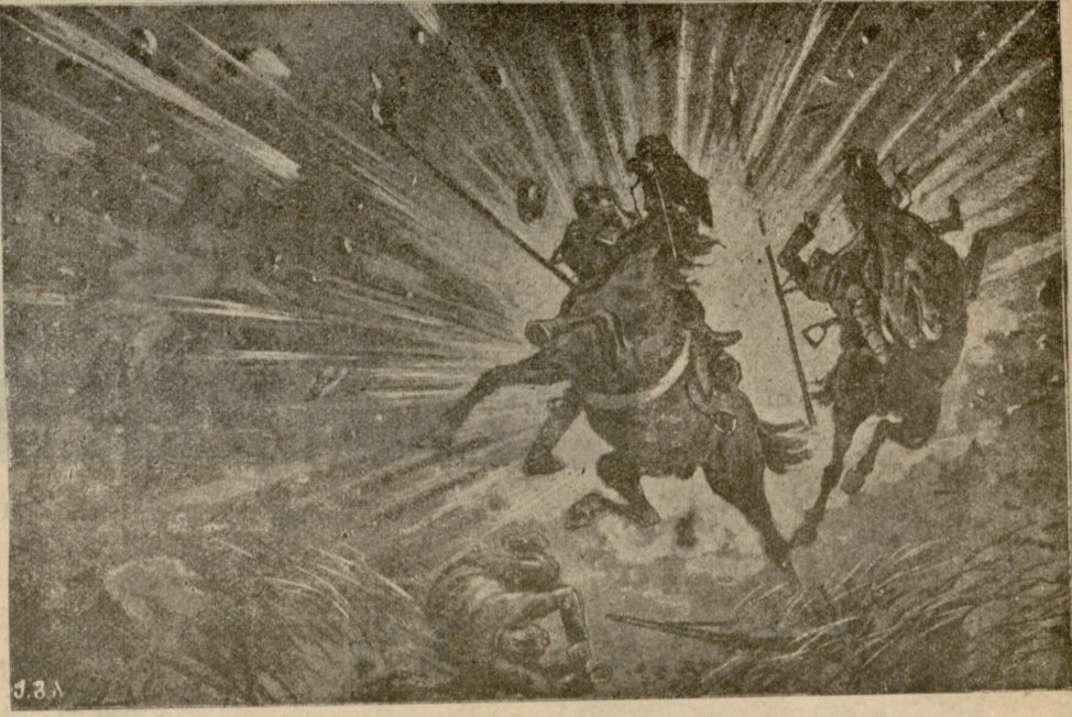
ი ვ ი თ ძ ა !..

— არა, თქვენ არა, — საჩქაროდ დაიძახა უტუმ. — ვდგები და ადექით თქვენც. თქვენ არ შეგშვენით დაჩოქება! თავისუფალი ხალხი მხოლოდ და მხოლოდ ღვთის წინაშე იჩოქებს!.. და თქვენც თავისუფალი ხარტ დღეიდან. გატეხილია ის უღელი, რომელიც გვიშავებდა და გვისიებდა კისერს; გაწყვეტილია ის ჯაჭვი, რომლითაც ვიყავით შებორკილი; გაახლებულია დღეს ჩვენში ის ადამიანური სული, რომელიც ღმერთმა ერთნაირი მისცა ბატონს და ყმას, მაგრამ ბატონმა ამოხადა ყმას... ეყოფა ბატონს რაც ინადირა ჩვენზე... ახლა ჩვენ ჩვენთვის ვიყოთ, ის თავისთვის... ხომ გინდათ ასე? ხომ თანახმა ხართ ყველა?