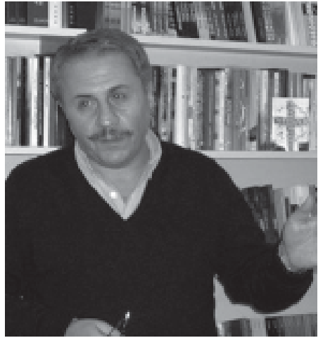
სჭირდებათ. ეს ცუდი არ არის, მათი უმეტესობაც არაჩვეულებრივი მწერალია, თუმცა პირადად მე ამას ვერიდები.

— რასაკვირველია, თუმცა ვცდილობ, ჩემს მკითხველს განსაკუთრებული მომზადება არ სჭირდებოდეს. მოგეხსენებათ, არიან ავტორები, ქართველებიც და უცხოელებიც, რომელთაც სპეციალურად მომზადებული მკითხველი