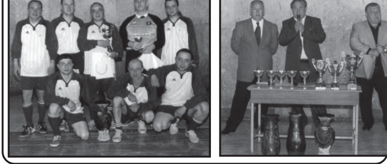
სპორტის განვითარების პროგრამის განხორციელება...