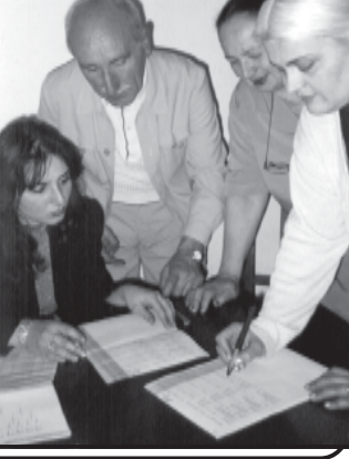
სპორტის განვითარების პროგრამის განხორციელება...