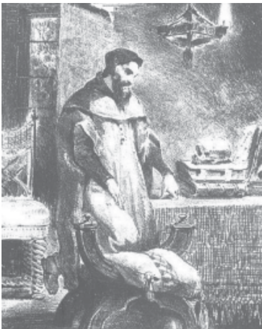
ეჰენ დელაკრუა. ფაუსტი

ეჰა, ფიოლო ერთადერთო, სალამი შენდა, ნახვეწო ბროლო, საწყაულო იდუმალ წვენთა, ხელობის მაღლი დაგატვიფრა ხელმა მხვეწელმა! თაროდან კრძალვით გადმოგიღებ, ან დადგა ჟამი! პირთამდე სავსეც სასიკვდილო კამკამა შხამით, პატრონსა შენსა დღეს სჭირდება შენი შენევა. გიცქერ და წყლული მიაბდება, ტკივილი დაცხრა! ხელში გიღებ და იწმინდება, ბორგავდა რაც რა, ნელდება ღელვა, ფუჭ ღამეთა ვტოვებ ლაბირინთს! წინ, ღია ზღვაში, აფრა ჩემი თამამად ივლის, დამიფენს ფერხთით მოსარკული ზვირთების ლივლივს, ახალი დილა და ახალი მიხმობს ნაპირი.