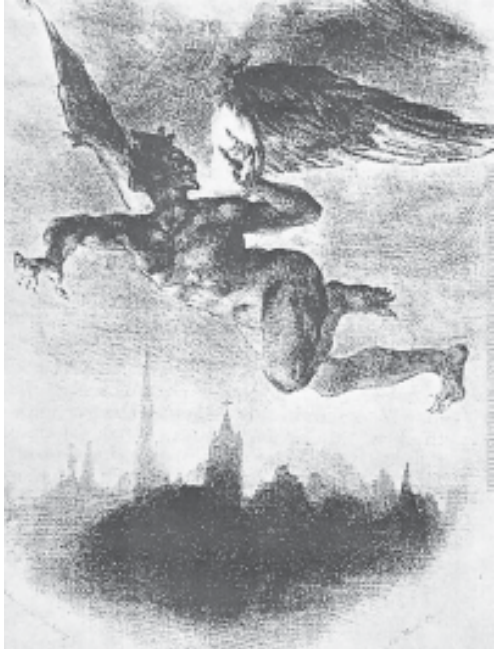
ეჰენ დელაკრუა. მეფისტოფელი