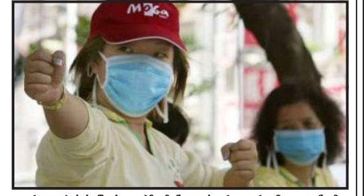
ჯანმრთელობის დაცვის მსოფლიო ორგანიზაციის მოგიწოდებს ჯანმრთელობის დაცვის მსოფლიო ორგანიზაციის მოგიწოდებს...