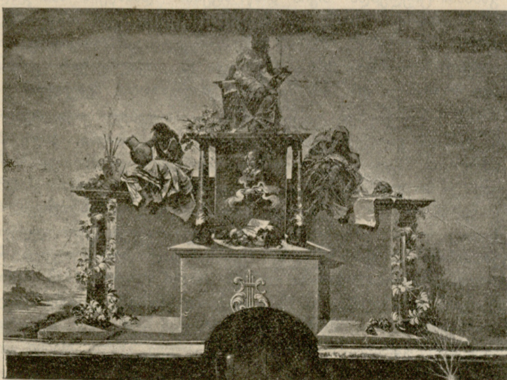
თეატრის წინა ფარდა.