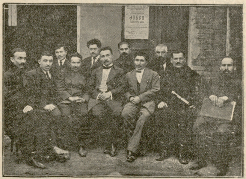
გამგეობა და სარევიზიო კომისია. წინა რიგში სხედან გამგეობის წევრები, უკანაში—სარევიზიო კომისიისა.