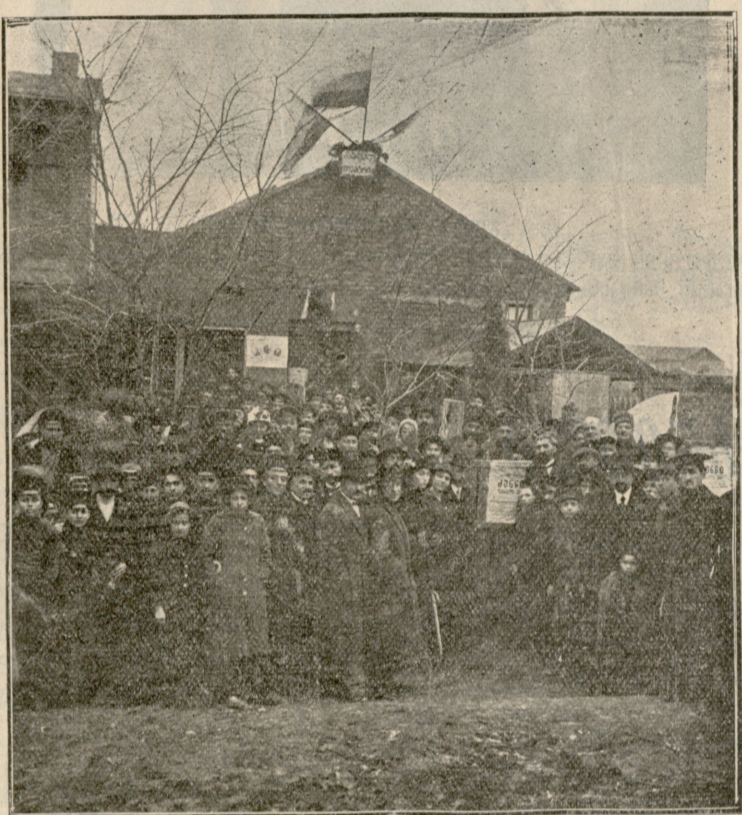
თეატრის შენობა. ხალხი შეგროვილია თეატრის კურთხევის გამო.