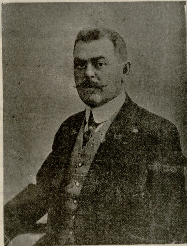
† ვარლამ გელოვანი.