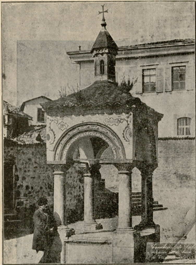
სოლომონ მეფის საფლავი ტრაპიზონში.

ახ, რა ცუდია დრო მიმავალი! გულცივია იგი და ბოროტი. რა იყო ისე შეენახა ტიმოთეც და თითონ მარინეც, როგორიც იყვნენ ისინი პირველს ჟამს შეუღლებიან. ხომ ადვილად შეეძლო მას ამის ასრულება. მაშინ სიხარულის სხივებით იყო მარინე მორთული და ყველაფერი ვარდისფრად ეჩვენებოდა. ალყავებულნი გაზაფხული იყო მისთვის იგი დრო, ქრელი, ლამაზი, თვალთწარმტაცნი.