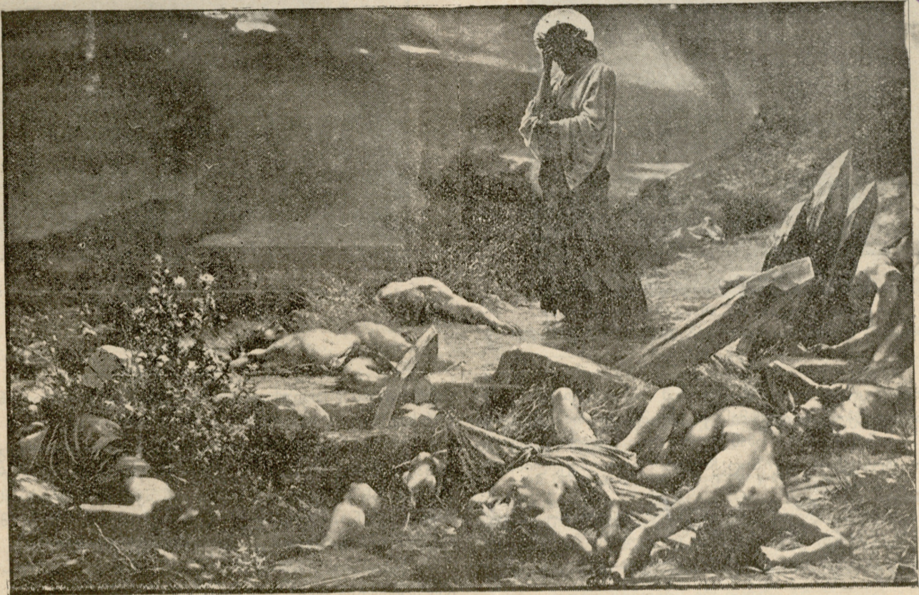
და ჰრძვა მათ: გიჟვარდეთ ერთმანეთი.