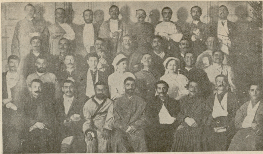
ნეიშვანებურგში (ლიფლანდიის გუბერნია) არსებულ ლაზარეთში მყოფი დაჭრილი ქართველი ჯარისკაცნი. (იხ. ლ. გახეთი).

— რა ოინი იქნება, რომ მოახერხოს მალხაზმა და შეარციოს ეს კაცი.