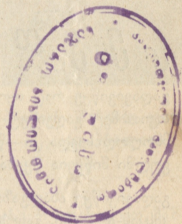
† ნიკო ლომოშვილი. (1852—1915).