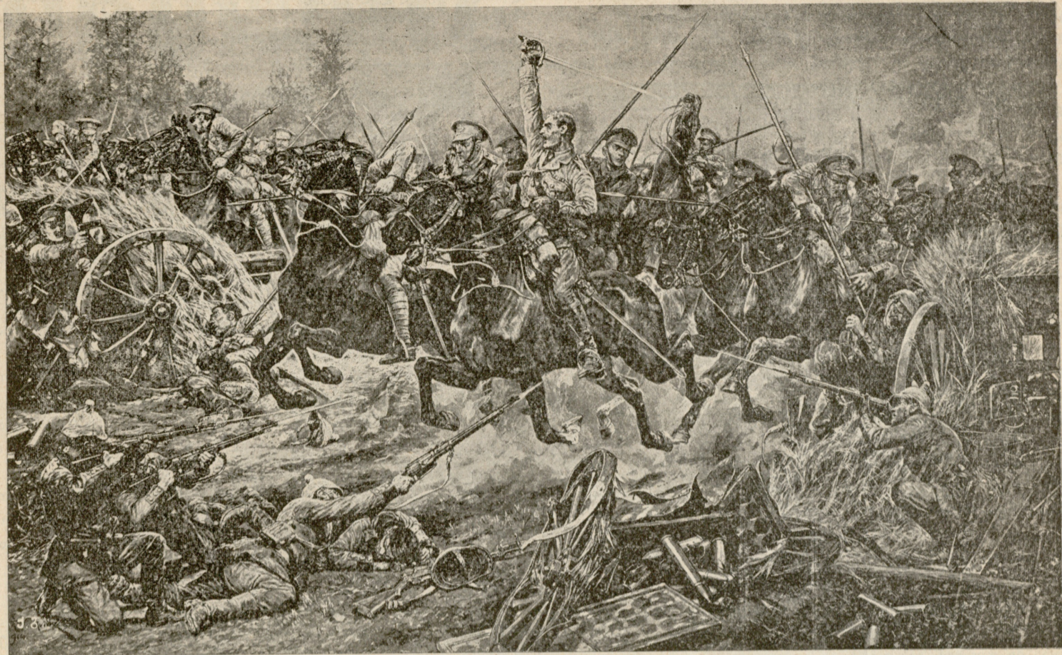
ინგლისელების ცხენოსანთა იერიში.