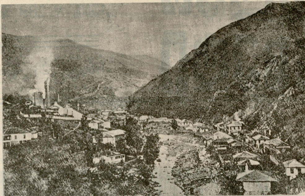
დანსულის სპილენძის მადნების ქარხნები მურლულის ხეობაში (ბათუმის ოლქი).