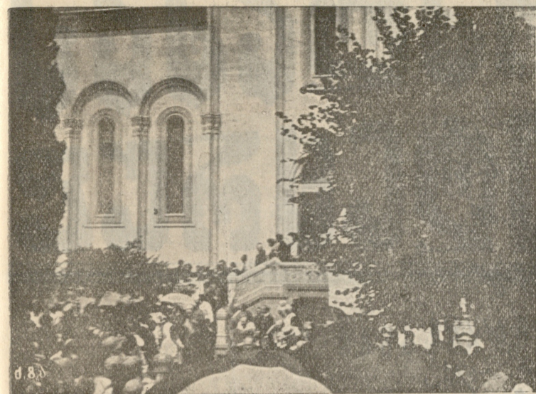
ეკლესიიდან გამოსვენება ცხედრისა.