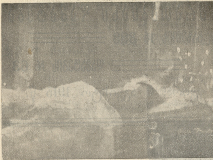
ვაჟას ცხედარი ქვაშვეთის ტაძარში.