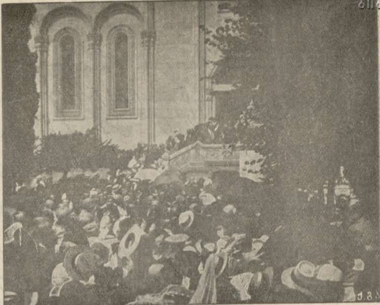
ვაჟას ცხედრის წინ ტაძრის ეზოში ბ-ნი ქადაგიძე სიტყვას ამბობს.