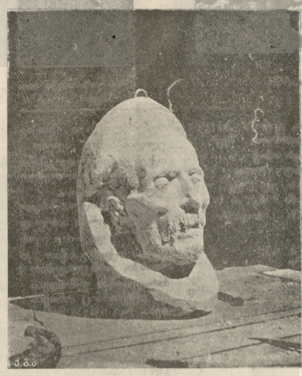
ვაჟა-ფშაველას ნიღაბი. გდლებულია ი. ნიკოლაძის მიერ.