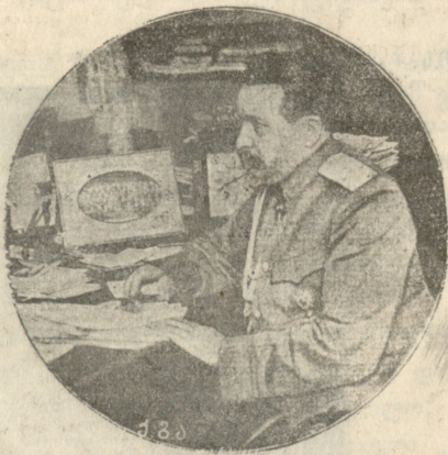
უმალღეს მთავარსარდლის შტაბის უფროსად ნამყოფი გენერალი იანუშკაჰვიჩი დანიშნული კავკასიის მეფის მოადგილის თანაშემწედ.