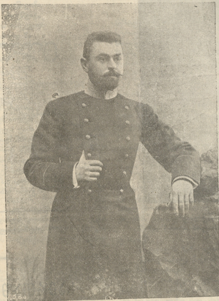
ვარლამ გელოვანი სტუდენტობის დროს.

ვარლამ გელოვანის გარდაცვალების ნახევარი წლის უსრულების გამო