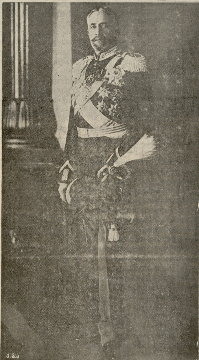
მისი იმპერატორადიტი უმაღლესობა დიდი მთავარი ნიკოლოზ ნიკოლოზის ძე დანიშნული მეთვის მოადგილედ კავკასიაში.