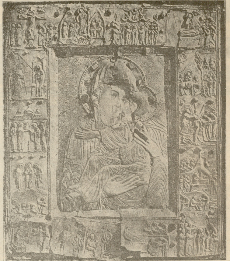
ფეოკამელის ღვთისმშობლის ხატი.