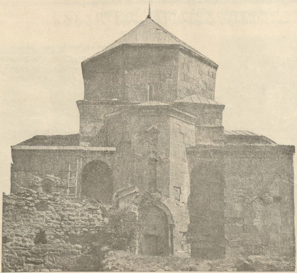
ჯვარის მონასტერი (აგებულია მე-VII საუკ.)