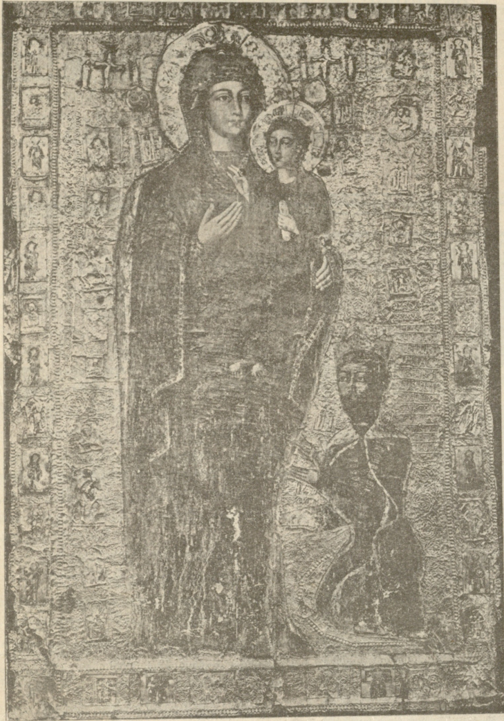
აფხაზის ღვთისმშობელი („ბაგრატის ლოცვა“).