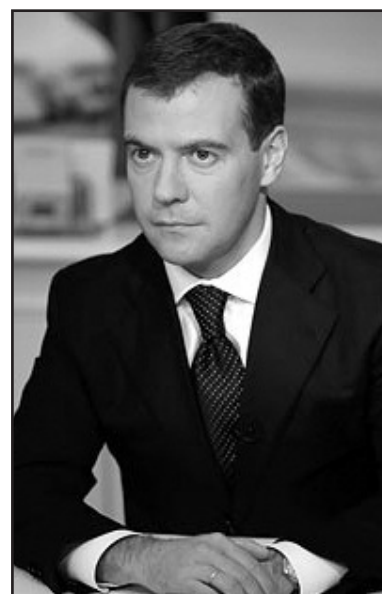
(გაგრძელება მე-9 გვერდზე)

განკარგულებას “საქართველოსთვის სამხედრო და ორმაგი დანიშნულების პროდუქციის მიწოდების აკრძალვის შესახებ” მედვედევმა ხელი მიმდინარე წლის 19 იანვარს მოაწერა.