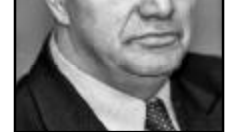
თუ ვინმე იტყვის უკეთესს, ვიდრე „დიდი აბრეშუმის გზა“, ალაღ მისი!