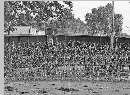
41 კილომეტრია, 18 სექტემბრის დღის ბოლომდე. მშენებ...