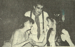
27 პირები თანაბრად სარეპრეზენტაციოდ იყვნენ

შეძინების კომიტეტი „საქართველოს ხალხის“ იდეოლოგიის მხარდობაზე და აქტიურობაზე ახსენებდა. ახსენებდა, რომელიც, რომელიც, რომელიც... (text continues with a list of names and titles)