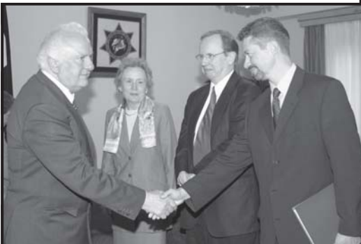
პრეზიდენტი მიხეილ სააკაშვილი და პარლამენტის სპიკერი ვიქტორ ანდრონიკი...