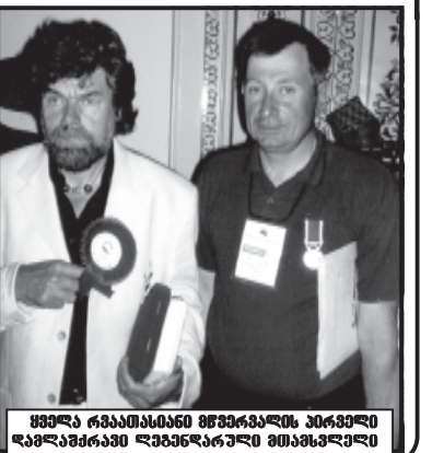
ფეხად რეპრეზენტაციის მუშაობის დასრულების შემდეგ, რაც ახალ-მედიანული მუშაობა დაიწყო. პირველი მომსახურების მუშაობის დასრულების შემდეგ (8848 წ.) თავზე ნებადართა მისი მუშაობის მიხედვით (დებარები ასე უნდა იყოს) პირველი ახალი ნაბიჯი უნდა იყოს საერთაშორისო საკითხის განხილვა პარლამენტის მომზადებასთან დაკავშირებით.

„დილა ამ გაზეთის ბადავლით დაიწყო...“ http://www.open.ge/sakartvelos-respublika ჩვენს გაზეთს კითხულობენ აფხაზი, ბერძენი, რუსეთი, პოლანდია, სურინამი, უკრაინა, სერბია და სხვა ქვეყნები.