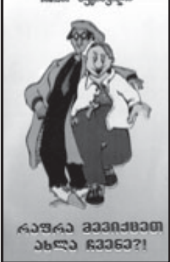
კარგად გემოვნად ახლა გვესმის!