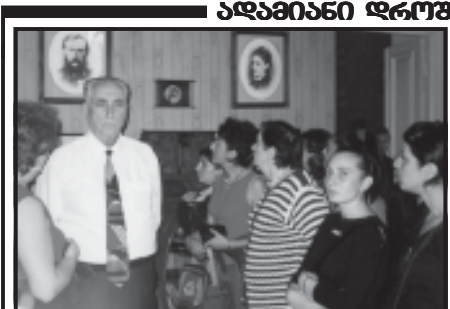
რეკრუტირების პროცესში მონაწილეობის მქონე ადამიანების ჯგუფი.