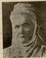
† რუშინის ქვრივი დედოფალი ელისაბავდი (კარმეხ სიღვბა).

წარსული ბატონი ფოსტამეტრისა შორიულ წელითა წიაღში იკარგება. მართალია მხოლოდ ის, რომ იმაზე არავინ არაფერი იცის