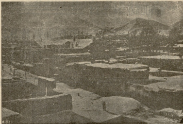
ა რ რ რ მ ი.