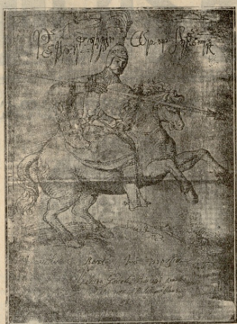
გურიის მთავარი ვახტანგ გურიელი.