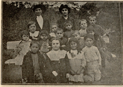
მამასკინა გომანიჟოა ბაღში.