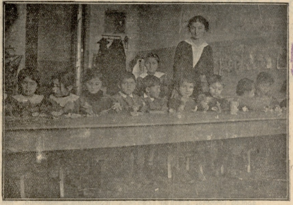
ბ ბ რ ვ შ ა.