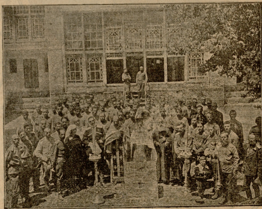
იხ. ბავსოზილის პანაზვიდი ქოიანი (სპარბითი).

— რამდინი ხანია არ შეგხედვარიჯათ, იადვიჯა! ყოველივს კი მინდა თქენ ნახე!