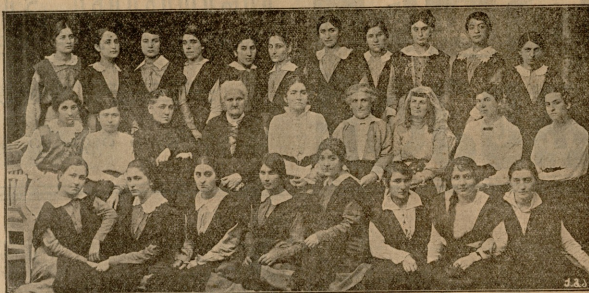
ქართ. ქალთა საქველმოქ. საზოგადოების სკოლის გამგენი, მასწავლებლები და მოწუენი (მესამე რიგში შუაში ოღა აელმაია ი. დღ. გზ.)